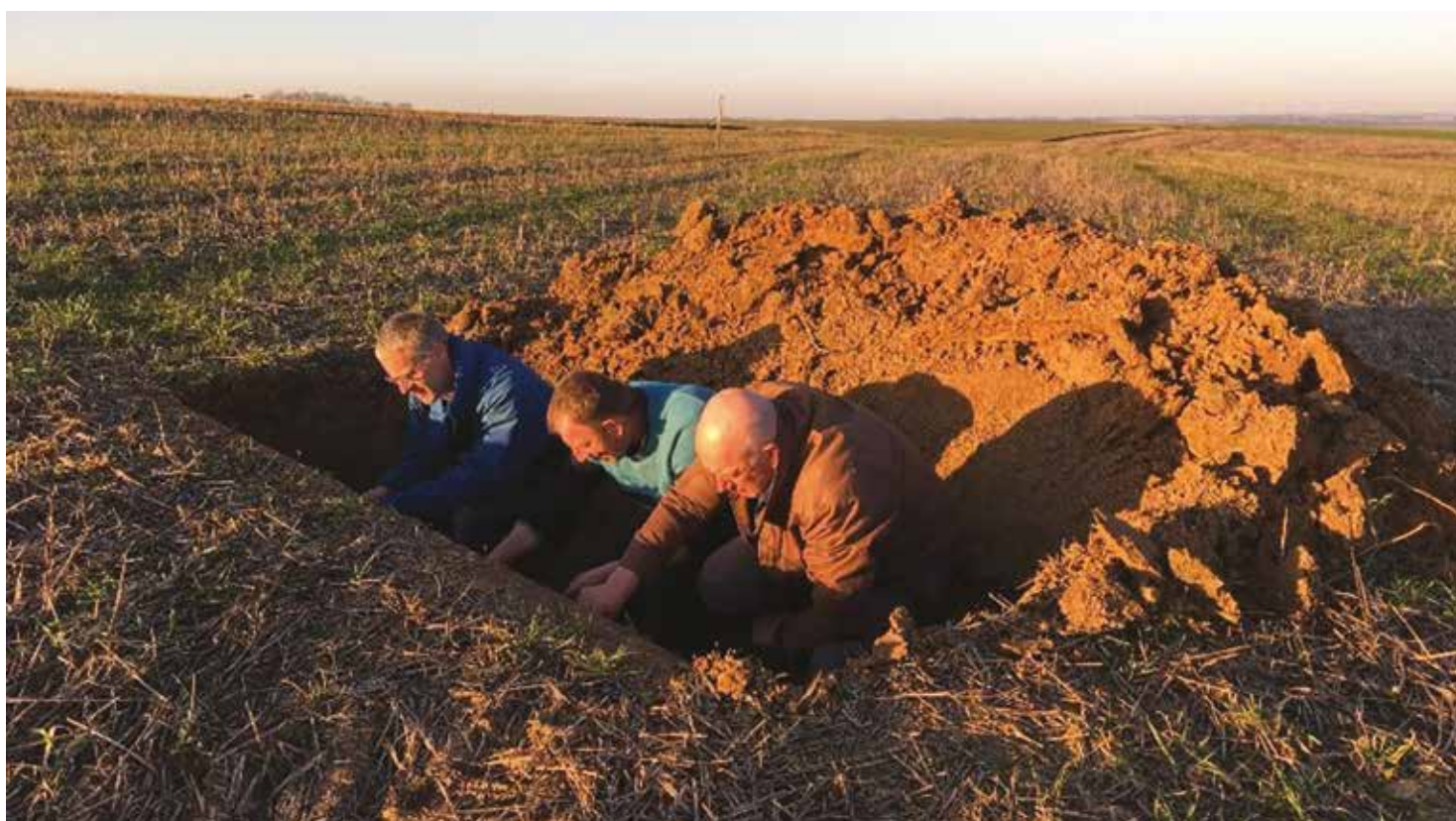
Agriculteurs d'un groupe Sols vivants à l'étude d'une fosse pédologique.