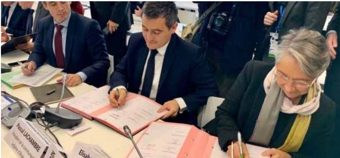
Gérald Darmanin, Ministre de l'Action et des Comptes publics et Elisabeth Borne, ministre de la Transition Ecologique et Solidaire signent la convention de financement du canal.

C'est à l'occasion de la visite du Président de la République dans la Somme à Nesle, le 22 novembre que la convention de financement définitive du Canal Seine-Nord Europe a été signée entre l'Etat, les collectivités et la Commission Européenne.