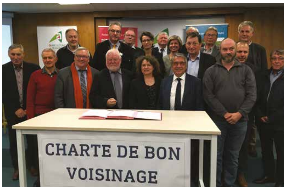
Les acteurs de la ruralité de la Somme signent la Charte de bon voisinage. La charte peut être consultée sur somme.chambre-agriculture.fr

Jean-Michel Serres, vice-président du Conseil régional a précisé quant à lui : «la charte de bon voisinage doit mettre à l'abris de réglementations nationales supplémentaires qui pénaliseraient encore un peu plus l'économie de cette région».