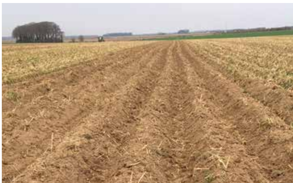
Parcelle de l'essai prébuttes d'automne en pomme de terre avant et après destruction du couvert.