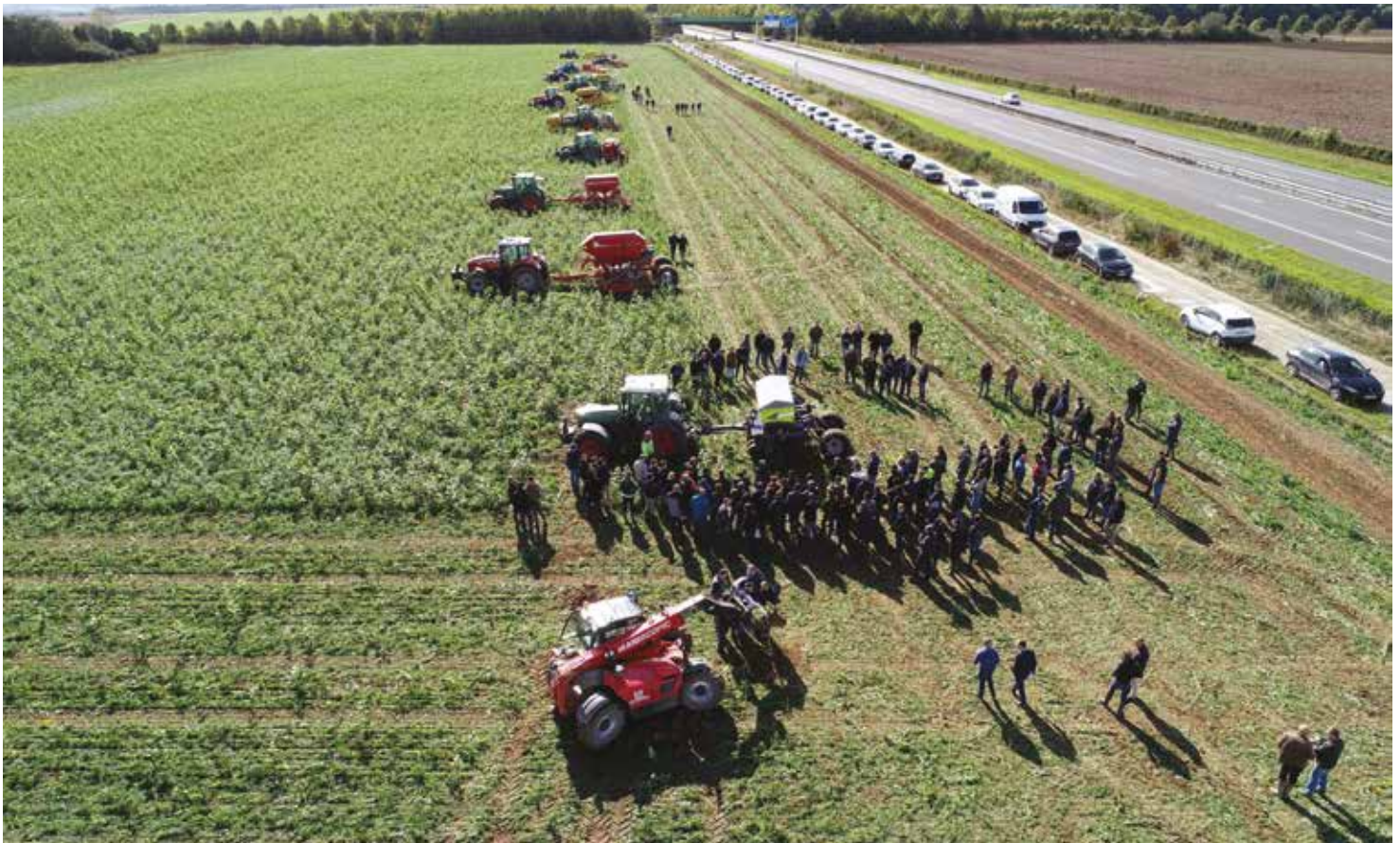
Vue aérienne de la démonstration de semis direct à Pont-de-Metz le 2 octobre.

Contact : Philippe Touchais - 03 22 33 69 78