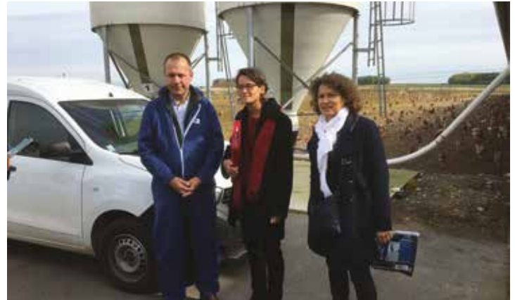
Le 2 octobre à la demande de la préfète de la Somme, la Chambre d'agriculture a organisé une rencontre sur le terrain auprès d'éleveurs et maraîchers pour faire le point suite à l'incendie de Lubrizol.

Dès l'annonce de l'incendie de l'usine Lubrizol, la Chambre d'agriculture a mis en place une cellule de crise. Avec les services de l'Etat, elle a relayé, auprès des agriculteurs des 39 communes concernées, toutes les informations concernant les restrictions de production définies dans les différents arrêtés préfectoraux. Les conseillers de la Chambre d'agriculture ont rencontré une cinquantaine d'éleveurs laitiers, maraîchers et producteurs d'œufs. L'objectif était d'aider ces agriculteurs particulièrement touchés à évaluer les pertes subies et à préparer leur demande d'indemnisation. Avec les OPA, la Chambre d'agriculture a préparé un barème d'évaluation des préjudices. Elle s'est aussi rapprochée des agriculteurs pour s'assurer que tous avaient pu établir leur déclaration dont la date limite de dépôt était fixée au 15 décembre 2019. La Chambre d'agriculture reste à l'écoute et à la disposition des agriculteurs pour faire face aux conséquences de cet événement.