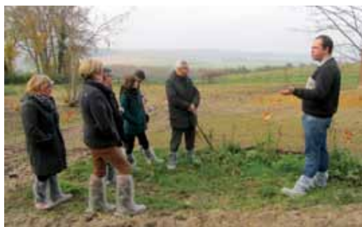
Porte ouverte professionnelle chez Sébastien JOLY à Saint-Fuscien

Les volailles de fêtes (dindes, chapons, poulardes...) sont souvent achetées démarrées pour limiter les risques de mortalité. La durée d'élevage est importante (150 à 180 jours) et il est nécessaire de les loger à l'aise pour éviter les luttes, en tenant compte de leur « encombrement » en fin d'élevage. En période de fête, la demande est forte, que ce soit au niveau des particuliers ou des acheteurs professionnels.