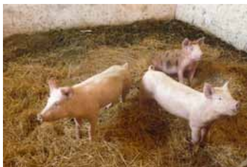
Porte ouverte professionnelle chez Emmanuel FREMAUX à Villers-Tourmelles

En plus de la découpe de viande fraîche, prévoir à plus ou moins long terme la transformation en charcuterie cuite, sèche ou fumée qui apporte une plus value importante.