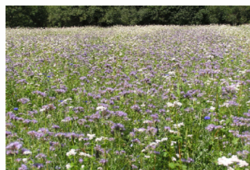
Aménagements favorables aux auxiliaires agricoles