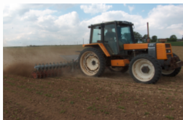
Production intégrée et techniques alternatives

Pour optimiser le fonctionnement des écosystèmes et limiter le recours aux produits phytosanitaires : deux leviers