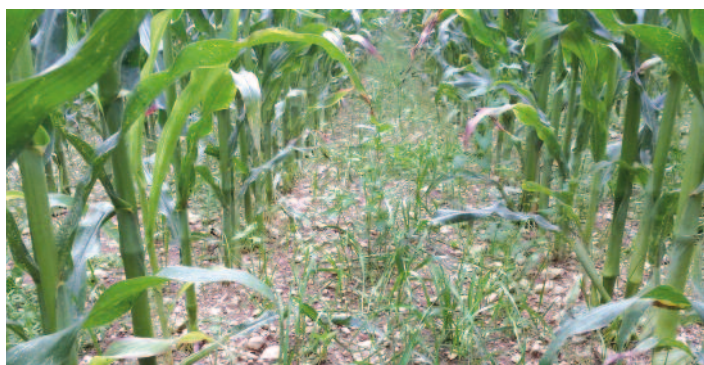
Couvert d'interculture sous maïs ensilage pour piéger l'azote du sol

Le projet est toujours en cours de réalisation, et ce jusqu'à 2018. Il vise à engager un maximum d'agriculteurs de ce BAC dans la démarche pour répondre aux enjeux forts de l'agriculture d'aujourd'hui.