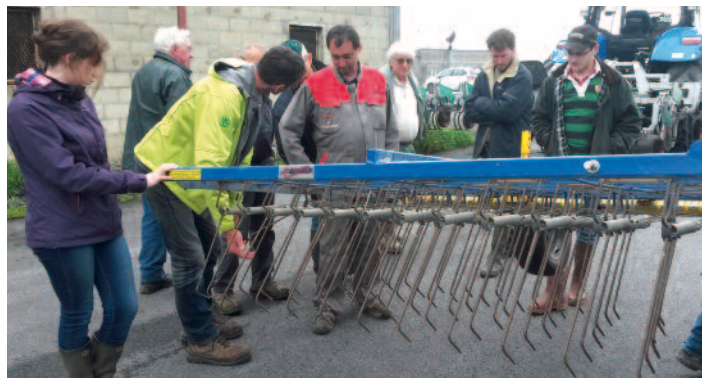
Démonstration de matériels de désherbage mécanique

Le conseiller propose un plan d'actions agronomiques et techniques, visant à résoudre les éventuelles difficultés relevées par le diagnostic. Ces actions proposées peuvent être de tout ordre (optimisation de la fertilisa-