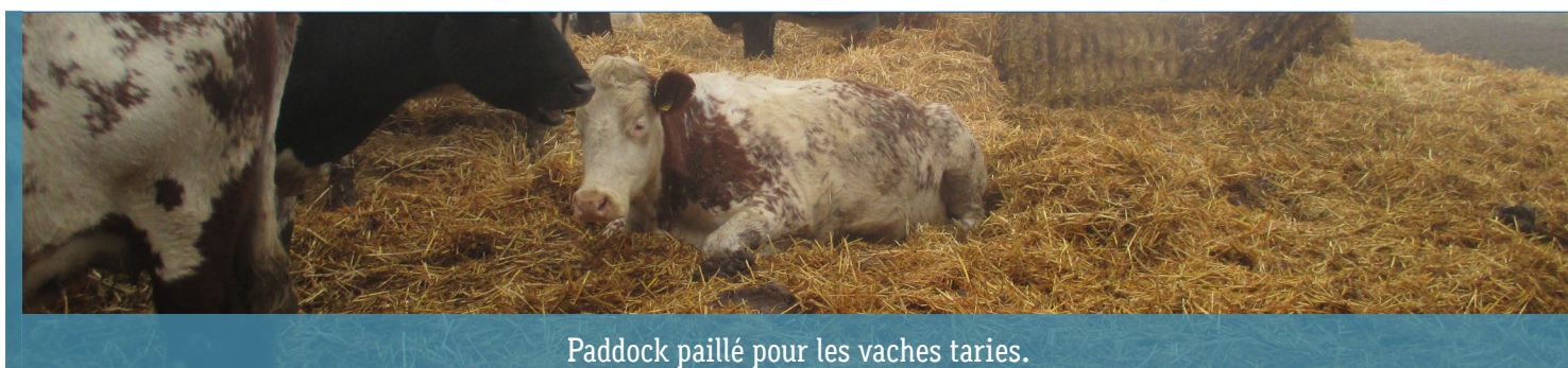
Paddock paillé pour les vaches tarées.