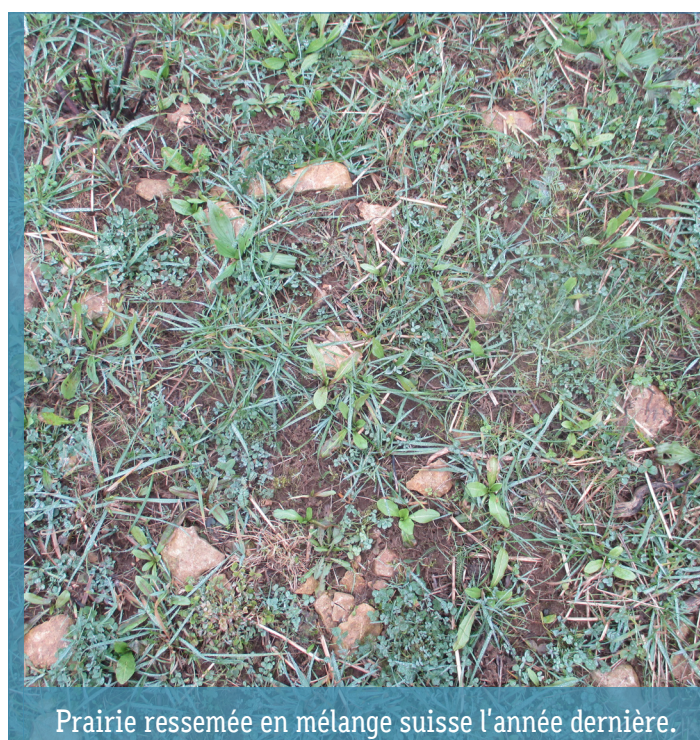
Prairie ressemée en mélange suisse l'année dernière.