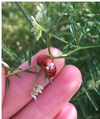
Couple de coccinelles asiatiques

Les conditions actuelles favorisent l'augmentation des foyers de pucerons sur les épis de céréales. Cependant, les auxiliaires sont nombreux et actifs, surtout les coccinelles, les syrphes et les parasitoïdes à cette période.