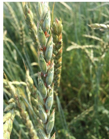
Pucerons parasités par des guêpes parasitoïdes (momies blanches duveteuses)

De plus les formes rouges ont souvent plus de 7 points et présentent un grand M noir sur la tête.