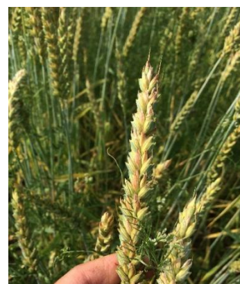
Symptômes de fusariose sur épi

Lutte : De fortes différences de résistance existent entre les variétés, préférer les variétés résistantes. Eviter les précédents maïs. Le broyage et l'enfouissement des résidus de graminées sont à rechercher pour réduire la pression de cette maladie.